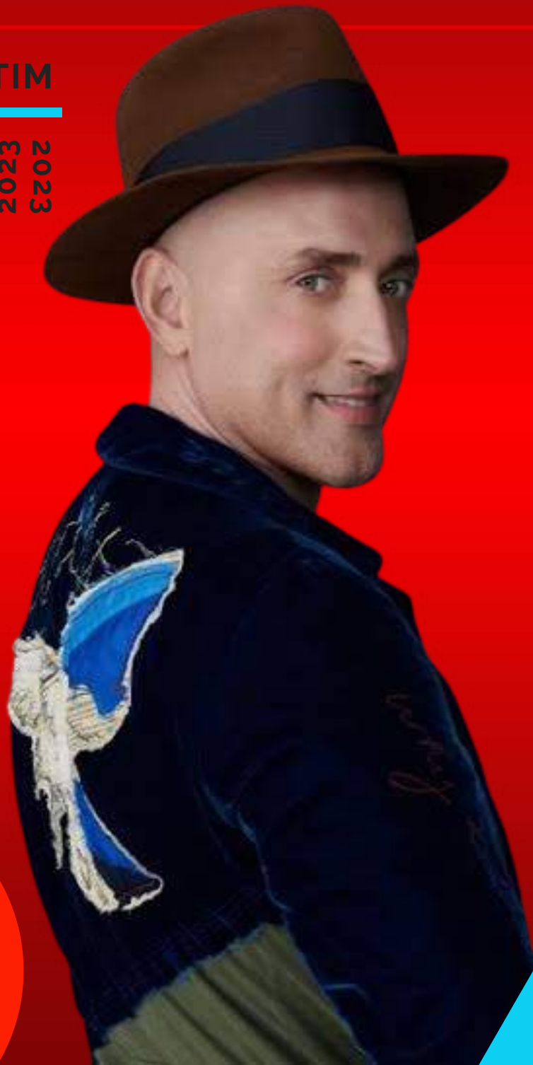
LEI PAULO GUSTAVO